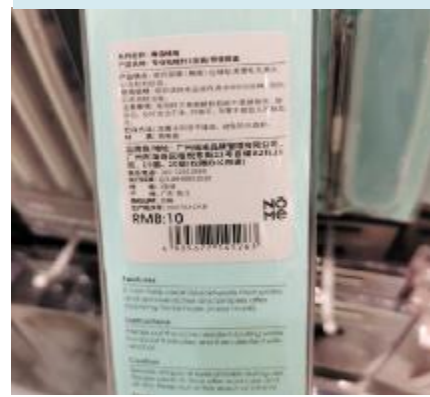
▲挤痘痘工具包装上没有安全风险提示