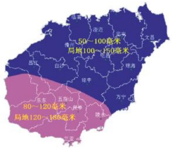
▲7月31日8时-8月4日8时过程累积雨量预报图

商报全媒体讯(椰网/海拔手机端记者 陈王凤) 热带低压携风雨而来,未来三天,小伙伴们要保护好阳台上易被吹落的物品,享受雨水带来凉快的同时也要保护好自己哦。