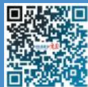
扫描二维码 看六项措施

记者从发布会上了解到, 除购车上牌一站办结外, 租赁汽车交通违法处理便捷快办、临时入境车辆牌证便捷快办等便捷快办服务以及全面推进小客车转籍信息网上转递、“两个教育”网上学习、交通事故多发点段网上导航提示等网上交管服务也将于9月20日起推行。