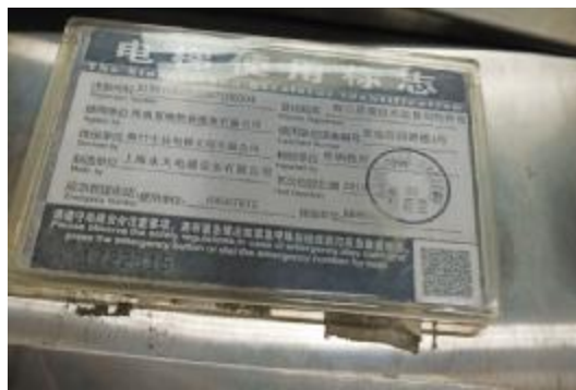
▲海口置地花园裙楼电梯使用标志为复印件且已过期

那么,海口其他的大厦、酒店、小区、高校、企事业单位的电梯安全情况怎么样?6月11日,记者走访海南省博物馆、海南省锅炉压力容器与特种设备检验所、燕海大厦以及龙昆南路上的多家酒店,发现三大问题。