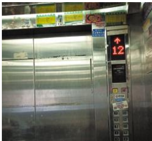
▲海口艺苑大厦电梯三个使用标志都贴在顶端