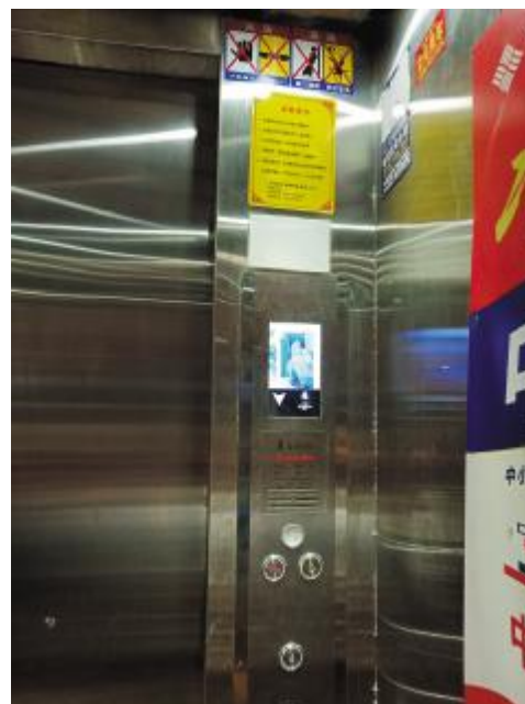
▲海口龙昆南符氏教育城电梯没有使用标志

物业或电梯维保公司则表示,电梯使用标志原件丢失后,补办比较麻烦,因此张贴复印件。