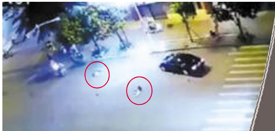
▲ 网传车祸视频 两名女子被撞飞