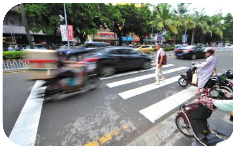
▲斑马线前,机动车不礼让行人

据公安部交管局统计,近三年来,全国共在斑马线上发生机动车与行人的交通事故1.4万起,造成3898人死亡,其中机动车未按规定让行导致的事故占了总量的90%。