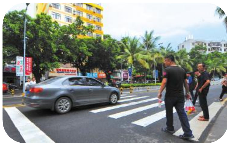
▲斑马线前,机动车不礼让行人